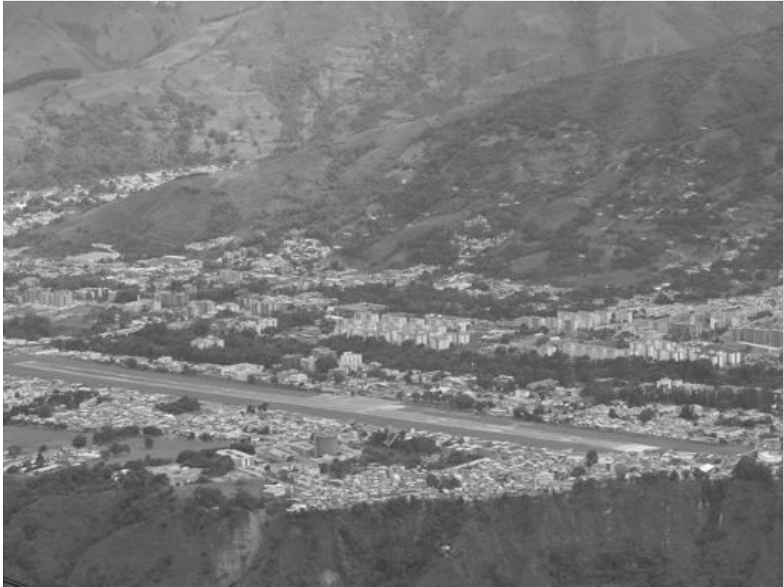
Figura 1. Vista parcial de la meseta de la ciudad de Mérida, con la infraestructura y modo de vida urbano. Al fondo, hacia la vertiente derecha del río Albarregas, en las laderas de las lomas se ubican: hacia la derecha de la fotografía, los barrios San Isidro, Mocoties, Monte Bello y parte del Pie del Tiro; y las comunidades campesinas Mocoties Alto y de Loma de la Virgen en la Llanada, todas en la antigua La Otra Banda hacia el sector sur de la ciudad de Mérida. Al sur, izquierda al fondo de la fotografía, la urbanización la Pedregosa (para la primera mitad del siglo XX fue una zona netamente campesina y de antiguos asentamientos indígenas, y luego sitios de encomienda) y en la ladera de Loma la Morita se ubica la comunidad campesina de La Morita.

En la urbana Mérida de hoy, ya no vemos al típico hombre campesino mezclado con el ciudadano como en la época de Picón Salas. Sólo los días sábados en el conocido Mercadito de la calle 20 y la avenida dos Lora de la ciudad y sus adyacencias, volvemos a recordar la otrora vida campesina de la ciudad cuando acuden los campesinos a vender sus hortalizas y flores. Pero cuando subimos por las laderas de la Pedregosa, de Loma la Virgen, Mocoties Alto o Pie del Tiro y arribamos a sus cimas nos topamos, de nuevo, con las estampas guardadas amorosamente en el