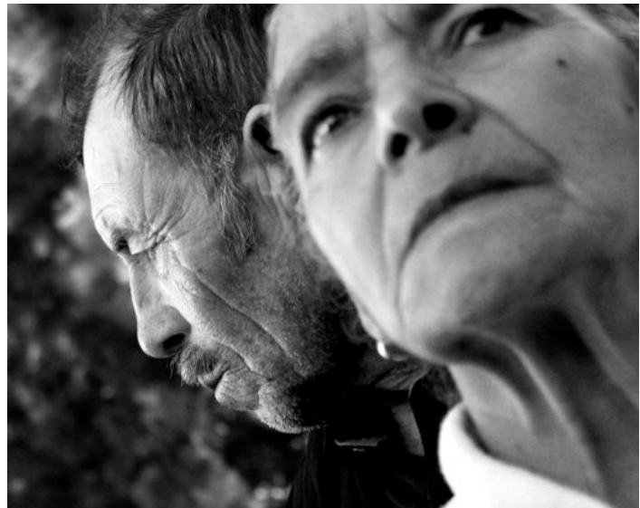
Figura 9. Fotografías Ciudad Portales de John Márquez. Instalación fotográfica en el casco urbano de la ciudad de Mérida, 2008.