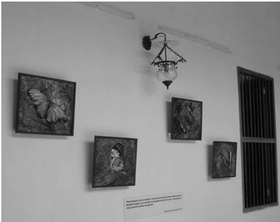
Figura 6. Serie Mariposas de Omar Cerrada, 2008 (Foto: Rebeca Arriaga. 2008).

“Mirando aquellos cielos de mi infancia –cielos que nunca descansan porque siempre lo recorren bandadas de pájaros- vine a descubrir una Geografía del aire llena de signos y mensajes que la mayor parte de los hombres no interpretan” (Mariano Picón Salas. Viaje al amanecer, 1981 ).