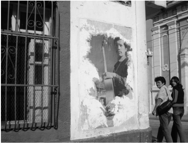
Figura 11. Instalación fotográfica en la avenida 4 con calle 19 de la ciudad de Mérida. Las fotografías muestran el póster en dos momentos: durante el primer mes de la exposición y cinco meses después (julio 2008).