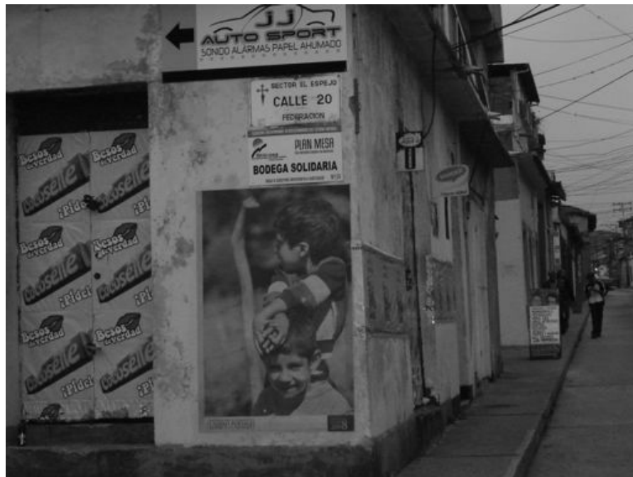
Figura 15. Instalación fotográfica, póster avenida 8 en esquina calle 17 de la ciudad de Mérida.

Por otra parte, tratar de promover el sentido de identidad con el lugar que se va perdiendo a medida que la ciudad va siendo intervenida por símbolos foráneos y los cambios de los usos urbanos tradicionales. Creemos que la mejor manera de intentarlo es comprendiendo y capturando el sentimiento de los habitantes hacia su espacio geográfico cotidiano (lugar), y aquél que le rodea y que todavía le permite perder su mirada en Cumbres como paisaje de añoranza para volver a recordar: