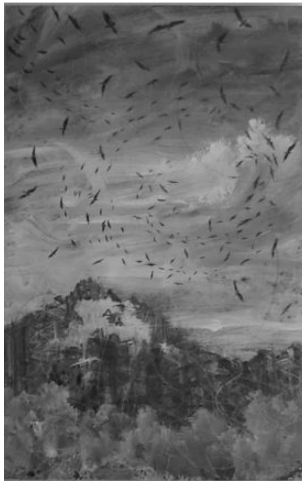
Figura 3. Cambio de pico de Omar Cerrada, 2008.