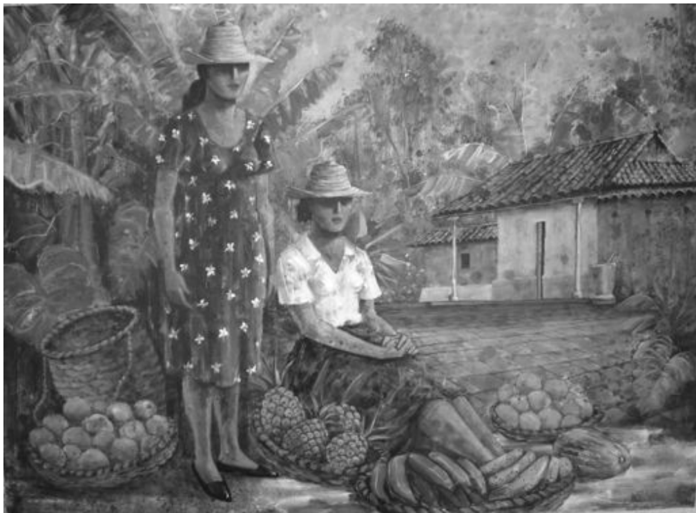
Figura 7. De la serie Mercados de Omar Cerrada, 2008. (Foto: Rebeca Arriaga. 2008).

5. Entre ambas series de paneles, se presentan dos series de pinturas que muestran la serie casas campesinas y la serie mercados . Ambos temas muy presentes en las obras de Picón Salas. Estas series están conectadas por el texto de Don Mariano Picón Salas “ Mozas Campesinas ” escrito en 1916 como nota o cartas de reflexión, y publicado en 1920 en su obra autobiográfica Buscando camino (Anexo 1).