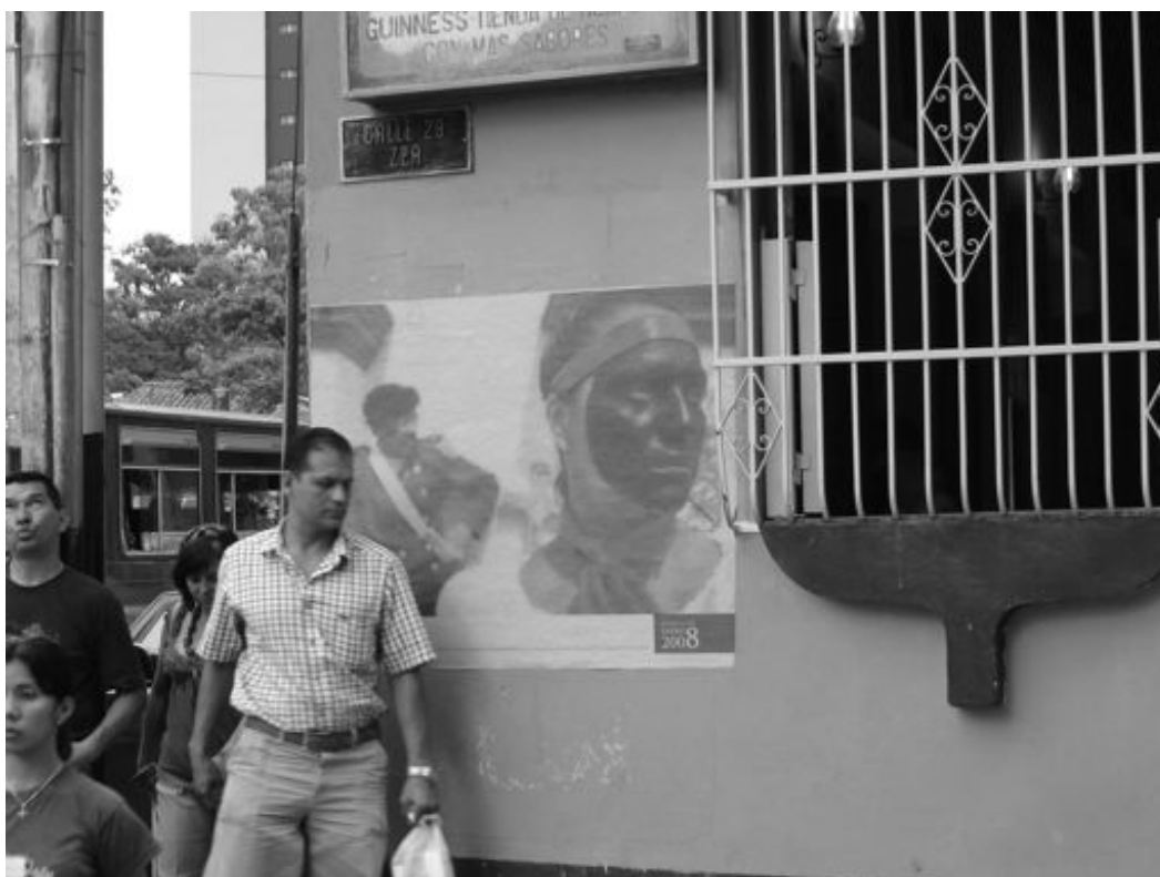
Figura 12. Instalación fotográfica en la avenida 3 con calle 23, sector Plaza del Llano de la ciudad de Mérida. (Foto: Rebeca Arriaga, 2008).

Por esta vía, consideramos que la experiencia entre el estudio etnogeográfico y la percepción desde la fotografía nos permiten abrirnos hacia la comprensión de los lugares y del paisaje; sigue presente nuestra idea de la no disociación entre las artes y la ciencia.