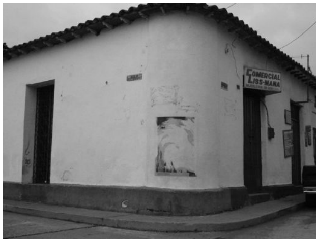
Figura 10. Instalación fotográfica en la avenida 8, sector Plaza del Espejo de la ciudad de Mérida. La primera foto muestra el póster del San Benito el día de la inauguración, y la segunda foto días después.

Por otra parte, está la visión de la geógrafa quien a medida que recorre la ciudad, también, contempla la obra fotográfica y empieza a observar y reflexionar acerca de lo que sucede entre la obra y el habitante de la ciudad: por qué ciertas fotografías fueron conservadas, cómo se aprecia que algunas fotos parecían pertenecer al lugar, cómo las imágenes ligadas con santos y fiestas parecen que tardaron más tiempo en ser rotas y/o rayadas. Por otra parte, efectuar un análisis más fino acerca de la misma curaduría pero en términos ya geográficos: cómo la gente se puede apropiar