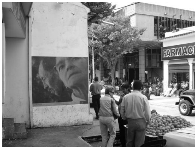
Figura 13. Instalación fotográfica: primer póster en avenida 3 entre calles 25 y 24; segundo póster en la esquina de la Plaza de Milla; y el tercer póster ubicado en la avenida 4 entre calles 18 y 19 de la ciudad de Mérida.