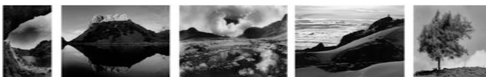
Figura 8. Mosaico de fotografías de paisajes merideños en formato panorámico de John Márquez, 2008.

7. En esta misma sección de la exposición se ubicaron fotografías del paisaje merideño actual, las cuales nos permiten evocar y sentir esa admiración por la maravilla de la creación de un paisaje tan diverso y lleno de fuerza como el de Mérida (figura 8). Allí se plasma todo ese amor y nostalgia del lugar vivido por Don Mariano Picón Salas.