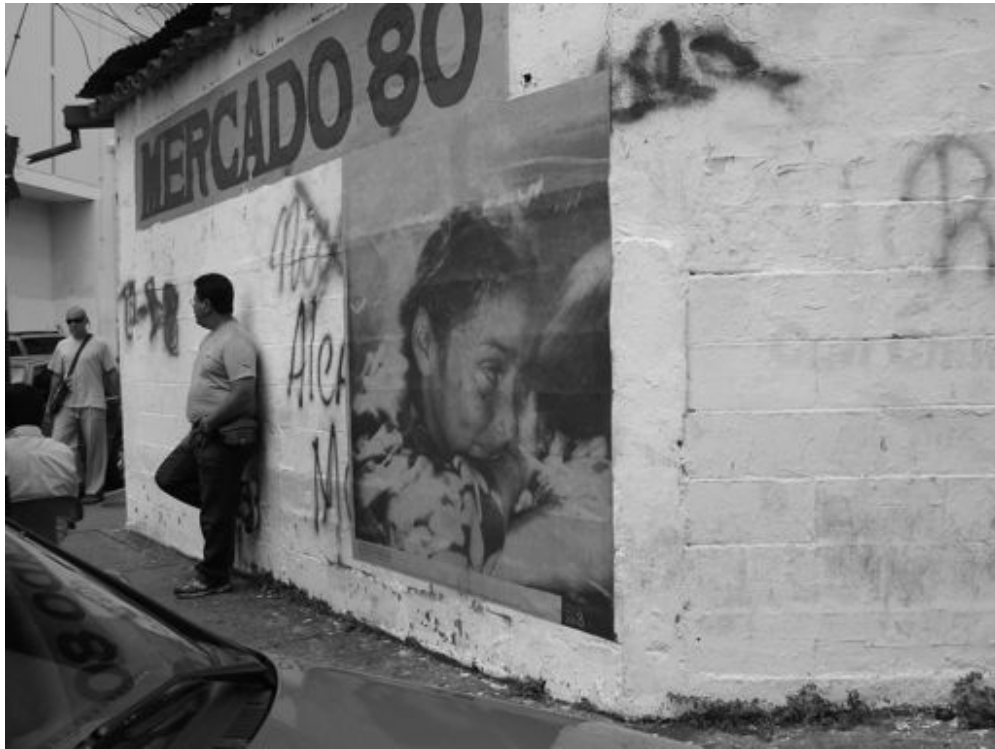
Figura 14. Instalación fotográfica, póster ubicado en la esquina de la avenida 5 con calle 21 de la ciudad de Mérida.

Por esta vía geocultural, entonces, repensar una planificación de los espacios urbanos que incorpore las expresiones artísticas como medios de calidad de vida, tal como quedó evidenciado en la receptividad que tuvo en los ciudadanos merideños la instalación fotográfica Ciudad Portales en el espacio urbano de la ciudad de Mérida