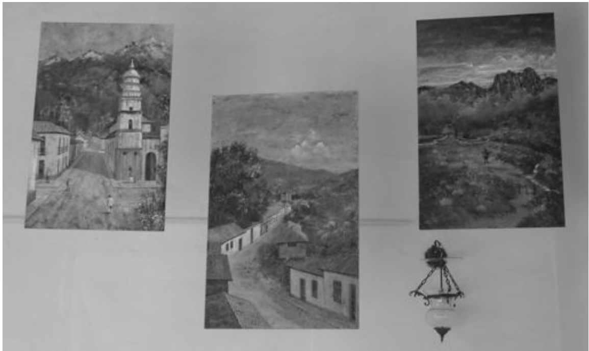
Figura 2. Serie de Paneles I de Omar Cerrada. De izquierda a derecha: Calle la Igualdad, Sol de los venados (2007), Avenida uno. Rivera del Albarregas (2008), Sierra de la Culata, Páramo de los Conejos (2008).