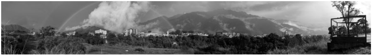
Figura 5. Fotografía panorámica de la meseta de la ciudad de Mérida en su zona norte, vista desde el sitio La Liria.